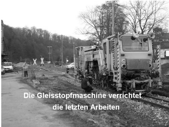
Die Gleisstopfmaschine verrichtet die letzten Arbeiten

Unser neues Vorstandsmitglied Wolfgang Böhmer war so freundlich, ein paar Zeilen zur aktuellen Lage im Weisseritztal zu schreiben: