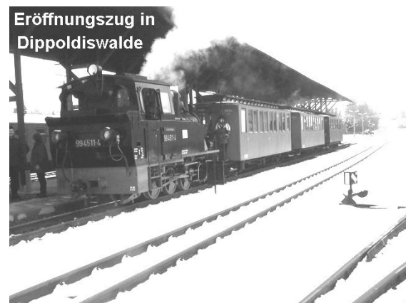
Eröffnungszug in Dippoldiswalde