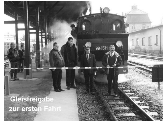
Gleisfreigabe zur ersten Fahrt

Vom 8 bis 23. Februar fanden wieder Fahrten statt, diesmal bei wunderbarem Winterwetter. Hoffen wir, dass es im Frühling mit dem Aufbau weitergeht. Mit freiwilligen Arbeitseinsätzen und Spendengeldern ist in diesen Bereichen allerdings wenig auszurichten.