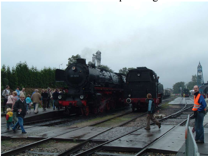
Bilder: S.4 unten: Maler in der Delfter Manufaktur

Höhepunkt für alle Dampflokliebhaber dann am Sonntag. Auf der Museumsbahn Apeldoorn – Dieren konnte man eigentlich nur positiv überrascht sein. Das Wetter war zwar ganztägig bescheiden, aber das Gebotene dafür vom Feinsten. Zurück nach gestern hieß das Spektakel mit mehr als einem halben Dutzend ehemaliger deutscher Staatsbahnloks, dichtem Zugverkehr mit dauernd wechselnden Bespannungen