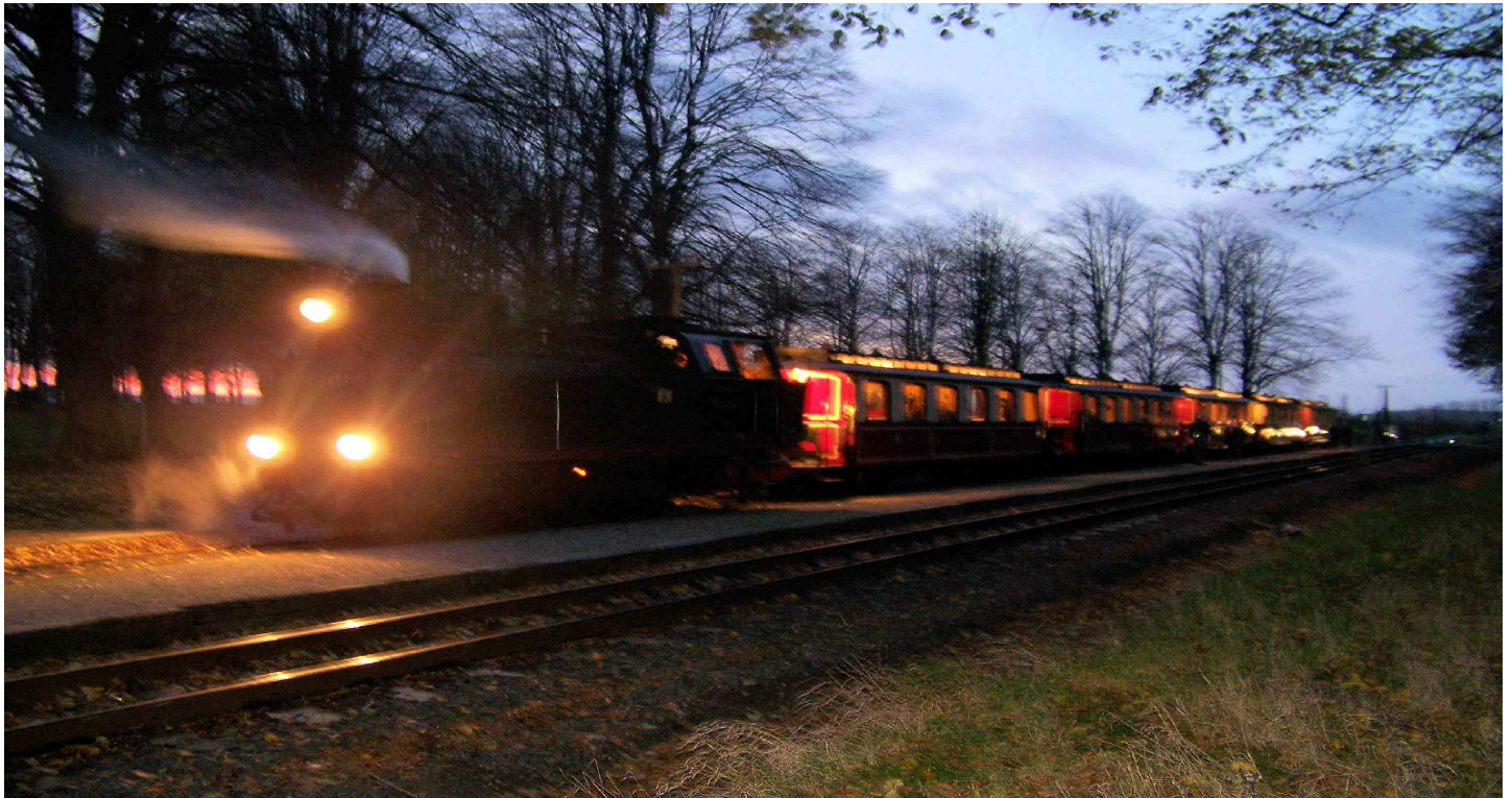
Unser Sonderzug an der Pferderennbahn in Bad Doberan

Club Homepage im Internet unter: www.dr-ehrenlokfuehrer.de Mit Gästebuch!