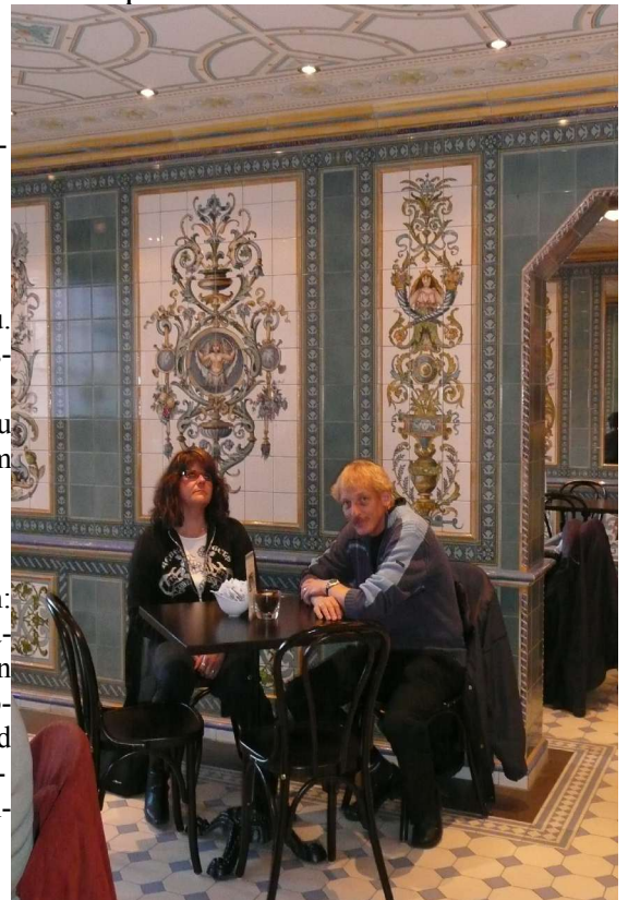
Bild unten: eine Bestätigung von den schönen und interessanten Eindrücken.