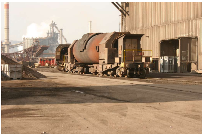
Bild vom Roheisentransport