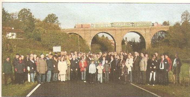
Die Teilnehmer vor dem Hauptersweiler Viadukt der Ostertalbahn

Am Freitag konnten sich die Teilnehmer für eine Werkstattbesichtigung der Saarbahn in Saarbrücken, einem Stadtrundgang in Saargemünd (F), einer Fahrt nach Metz (F) mit Besichtigung des Stellwerkes vom Bahnhof Metz Ville, einem Stadtrundgang und einer Führung im Metzger Bahnhof entscheiden. Der Samstag stand ganz im Zeichen der Stadt Ottweiler, dem schönen Ostertal und seiner Ostertalbahn, der Jahresversammlung in Schwarzerden, einem Besuch der Burg Lichtenberg und der Abschlussveranstaltung im Ottweiler Schloßtheater.