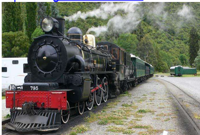
Dieses ist der „Kingston Flyer“ und

Zum Auffüllen der letzten Seite ein paar Bilder aus Australien von Helmut Möller aus seinem Fundus: http://www.globetrotter-foto.de