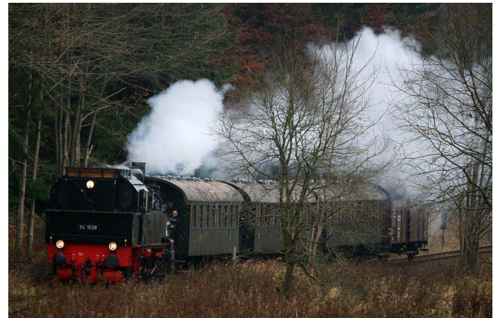
Bilder (5) von Helmut Möller

und Umsetzen der Lok hielten die Fotografen und Filmer in Bewegung. Zur Stärkung gab es Bockwürste mit und ohne Erbsensuppe – die gut war wie bei Mutttern – ging es durch die herbstlich schön „gemalte“ Landschaft.