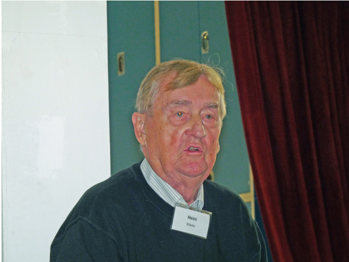
3 x geballtes Fachwissen ^4x!