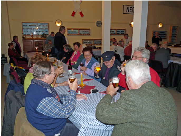
Der 1. Gemeinschaftsabend in zünftiger Umgebung