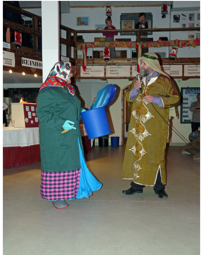
Perfekt u. mitreissend, das zeigen 3 folgenden Bilder.