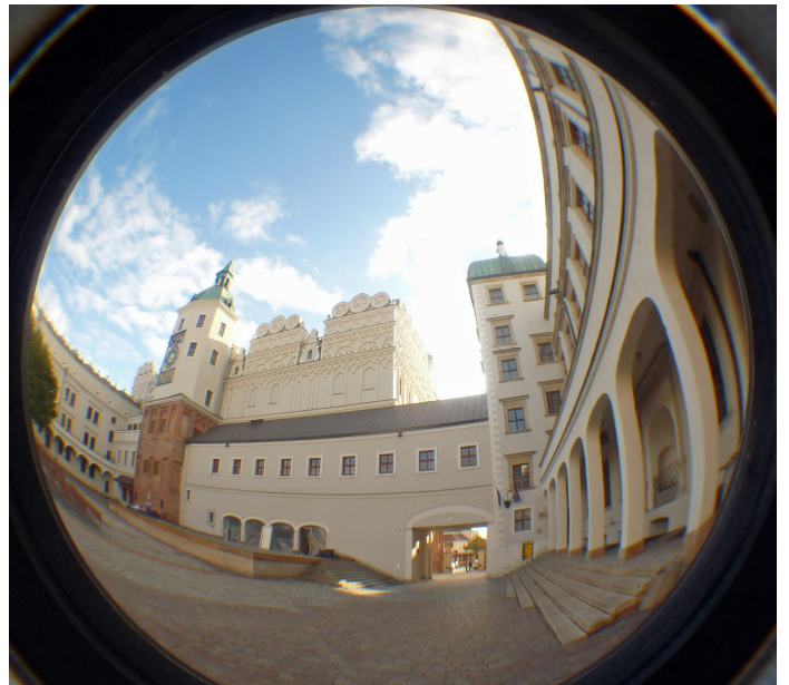
Schloß Stettin im Rundblick

Fast voll besetzt „unsere Ferkeltaxe“, was zu intensiver Kommunikation führte, wie wir hier sehen. Kaum einer vermisste „Dampf-/Diesellok“, wie im Programm am 1.7.10 geschrieben.