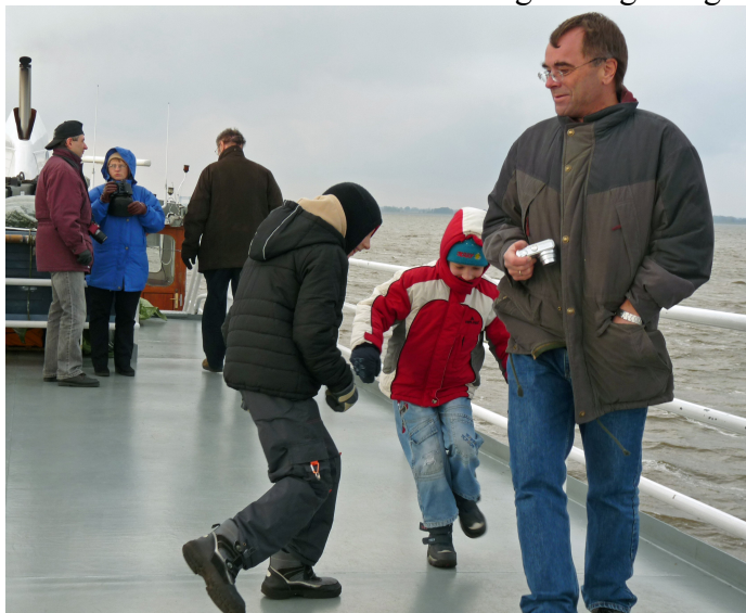
Zu einer Seefahrt gehört Wind