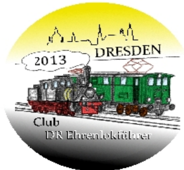
Unser Button 2013

Scheu vor der Entscheidung. Euer Sekretär