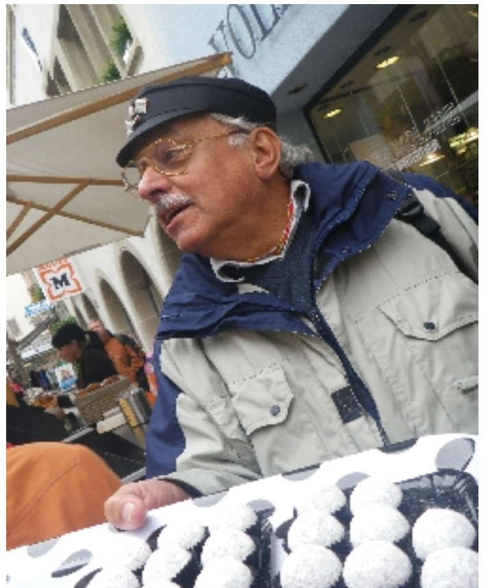
... wie er lebt und lebt! Bild v.d. JHV 2012 die Red.