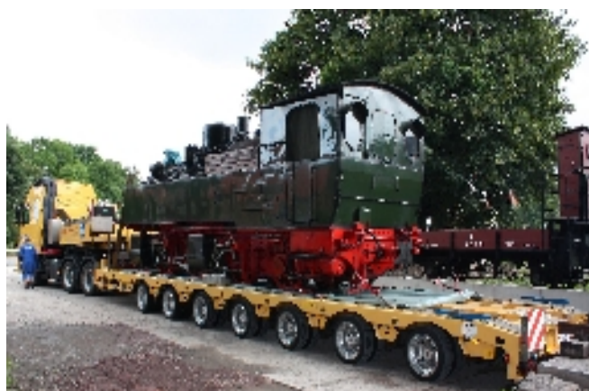
Viele Grüße (auch an die CLUB Kollegen); Danke nochmals und weiterhin gute Zusammenarbeit!