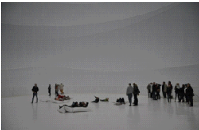
Der Innenraum von „Big Air Package“

Nun konnten wir das „Big Air Package“ auf eigene Faust betreten, betasten und erleben: Ein Raum ganz in Weiß, von scheinbar riesiger Ausdehnung, Leere und Ruhe. Der Besucher musste sich dessen erst einmal bewusst werden. Absolute Ruhe und nur dieser Eindruck der Größe -unbeschreiblich! Überall la-