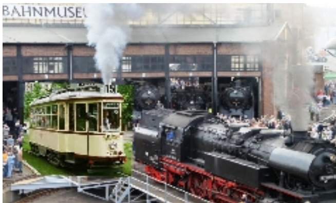
Der „Hecht“, der uns zur JHV fahren sollte ist..