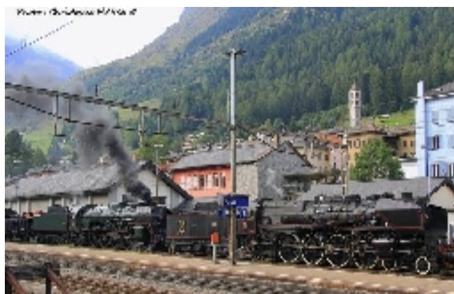
HSB-Lok 99 5902 Bauj.1898 nach Meinigen !