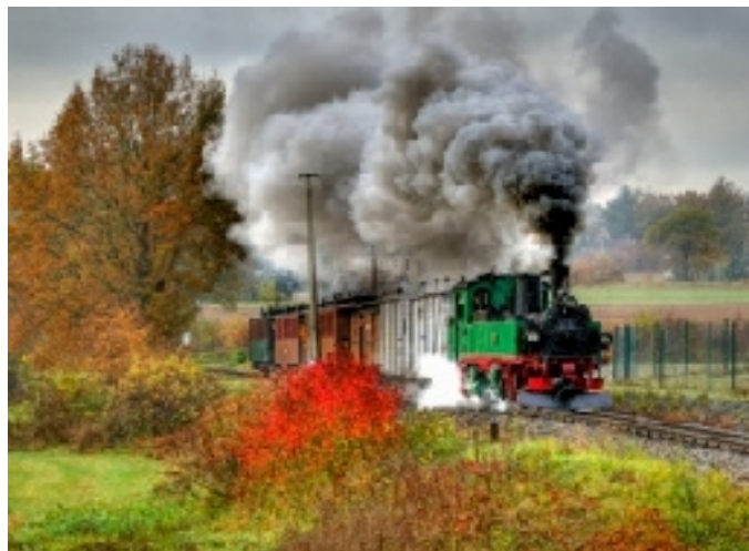
im Kuppelsaal der „Yenidze“ (früher Zigarettenfabrik) wurde gespeist... Unser Sonderzug, auf der Löbnitz(Dackel)grundbahn