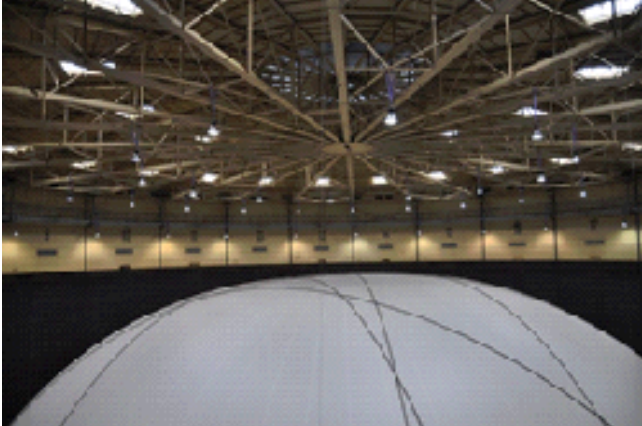
Blick aus 115 m auf die Package

Dann fuhren wir mit dem gläsernen Aufzug zwischen Package und Gasometerinnenwand zum Dach auf 115 m hinauf. Dieser Anblick