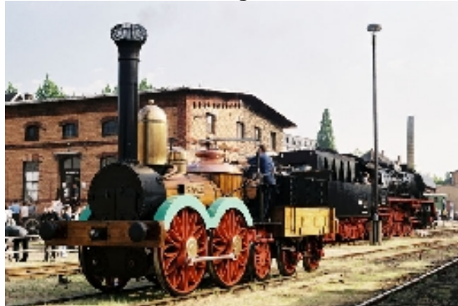
Allweil Gut Dampf und immer eine Handbreit Eisen unterm Rad! Euer Alfredo, DD-Altstadt