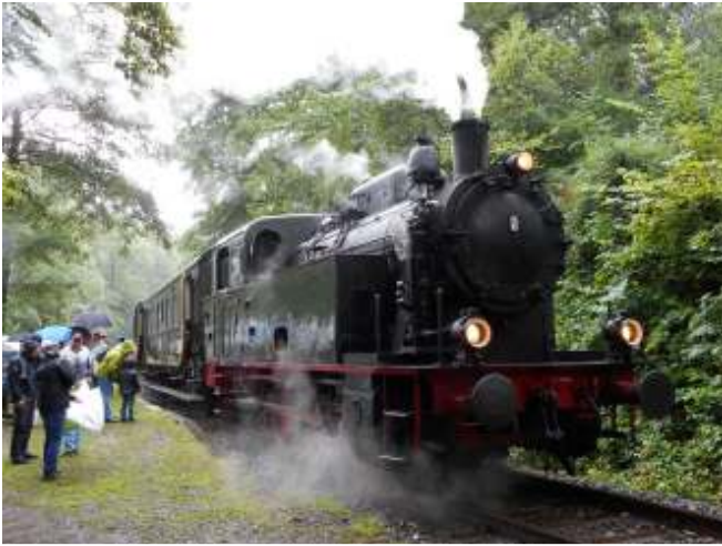
Dampflok D 8 von Krupp, Bj. 1961, 45 km/h, Leistung 430 PS, vormals Traditionslokomotive der RAG.

Mit Schließung in der Nähe von Haus Scheppen ansässigen Zeche Pörtingssiepen 1973 wurde die Eisenbahn nicht mehr benötigt. Bereits zwei Jahre später gründeten engagierte Eisenbahnfreunde die Hespertalbahn e.V., um dieses Industriedenkmal zu retten. Seither wird die heutige Museumseisenbahn von der Hespertalbahn e.V. erhalten und mit Dampf und Dieselloks betrieben. Sie ist eine der ältesten Museumseisenbahnen in Deutschland.