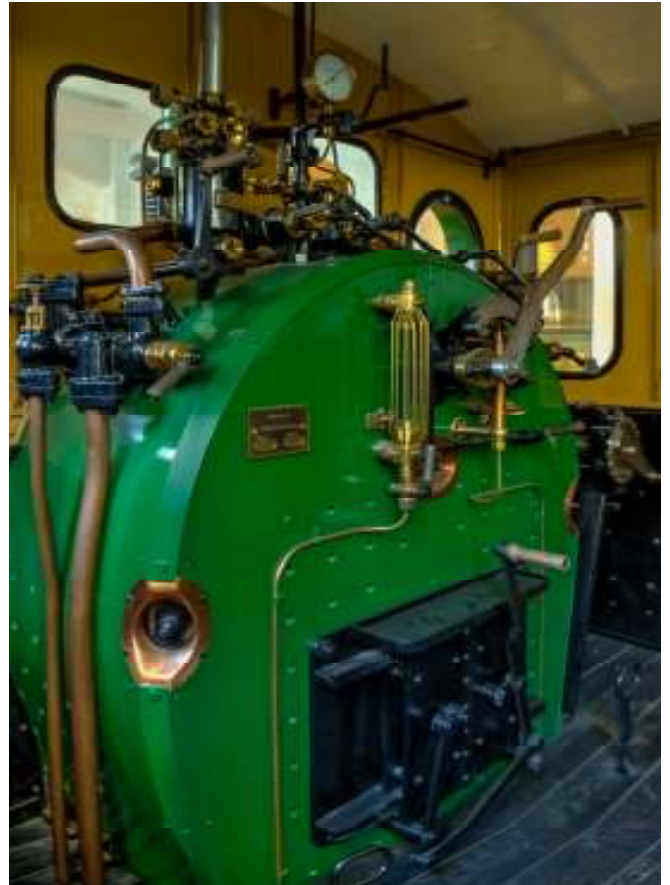
Der Lieblingsstandort für ELF! geworden. Auch hier gilt, immer mal wieder vorbeischaun, denn Sonderausstellungen und die H0-Anlage mit der „Spieltechnik“ der sechziger Jahre faszinieren gerade uns „Alten“!

Das vor kurzem (1-2 Jahre) umgebaute Eisenbahnmuseum ist sehr informativ